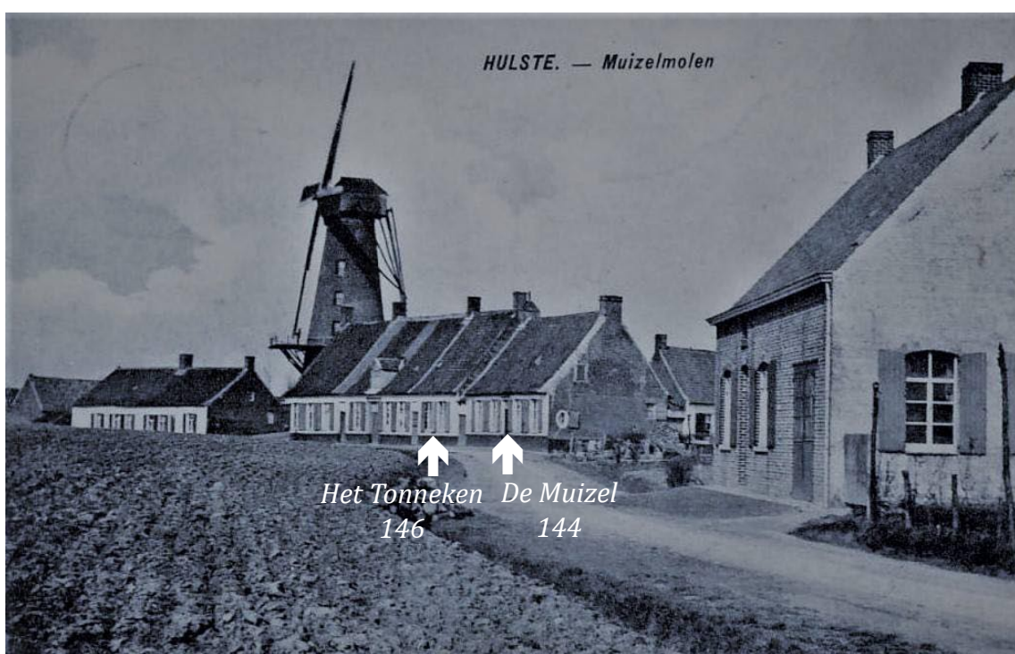
Oude postkaart met herberg De Muizel, herberg Het Tonneken en De Muizelmolen