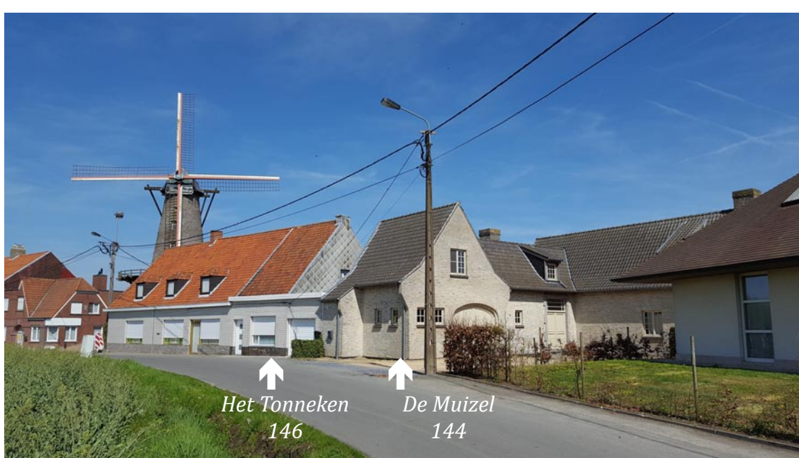
Café De Muizel nu: de nieuwbouw in het midden van de foto.

Deze herberg stond al vermeld, echter zonder naam, in het landboek van Hulste van 1715 als hofsteden ende herberghe groot 1 hondert en 5 roeden .